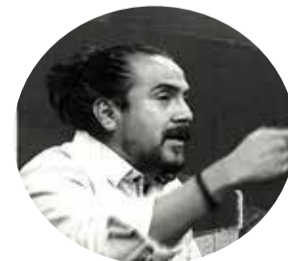
Por: Martín Moreira Analista Económico

El tercer factor identificado es el contrabando a la inversa, donde productos de Bolivia son llevados a países vecinos debido a los precios más bajos en el mercado boliviano. Este fenómeno reduce la oferta local y contribuye al aumento de precios.